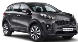
E5B - Dark Gun Metal 2