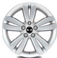
Leichtmetallfelge 17 Zoll mit 225/60 R17