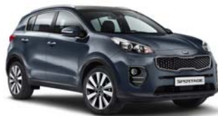
D7U - Planet Blue 2