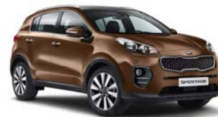
MYB - Bronze Metal 2