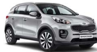
KCS - Sparkling Silver 2