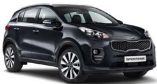
1K - Pearl Black 3