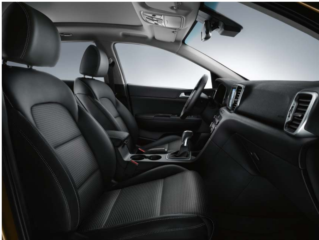
WK - Schwarz / Textilsitze