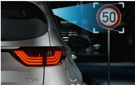
SLIF - Tempolimit Informationssystem