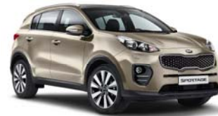
C2S - Canyon Silver 2