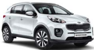
WD - Casa White 1