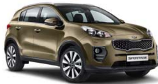
A2E - Alchemy Green 2