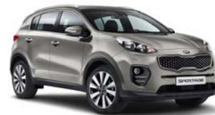
AA3 - Sirius Silver 2