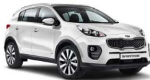
HW2 - Deluxe White 3