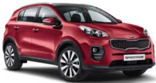
AA9 - New Infra Red 2