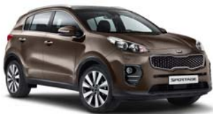
D5U - Sand Track 2