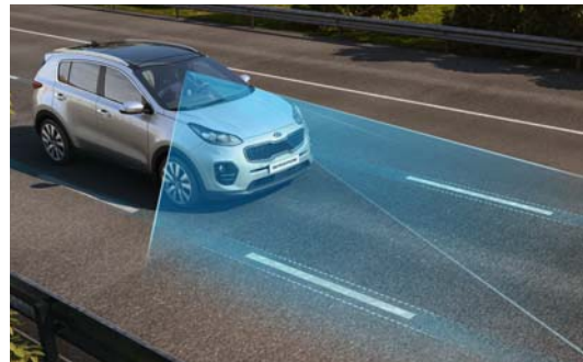
LKAS - Spurhalteassistent