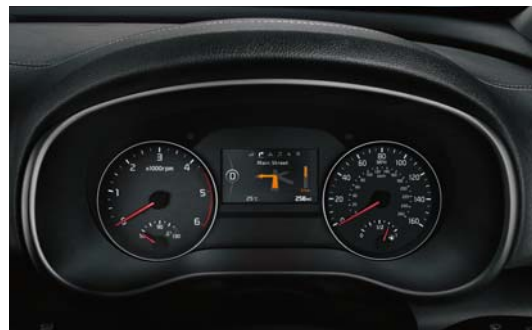
Supervision Cluster mit 4,2" TFT LCD Farbdisplay